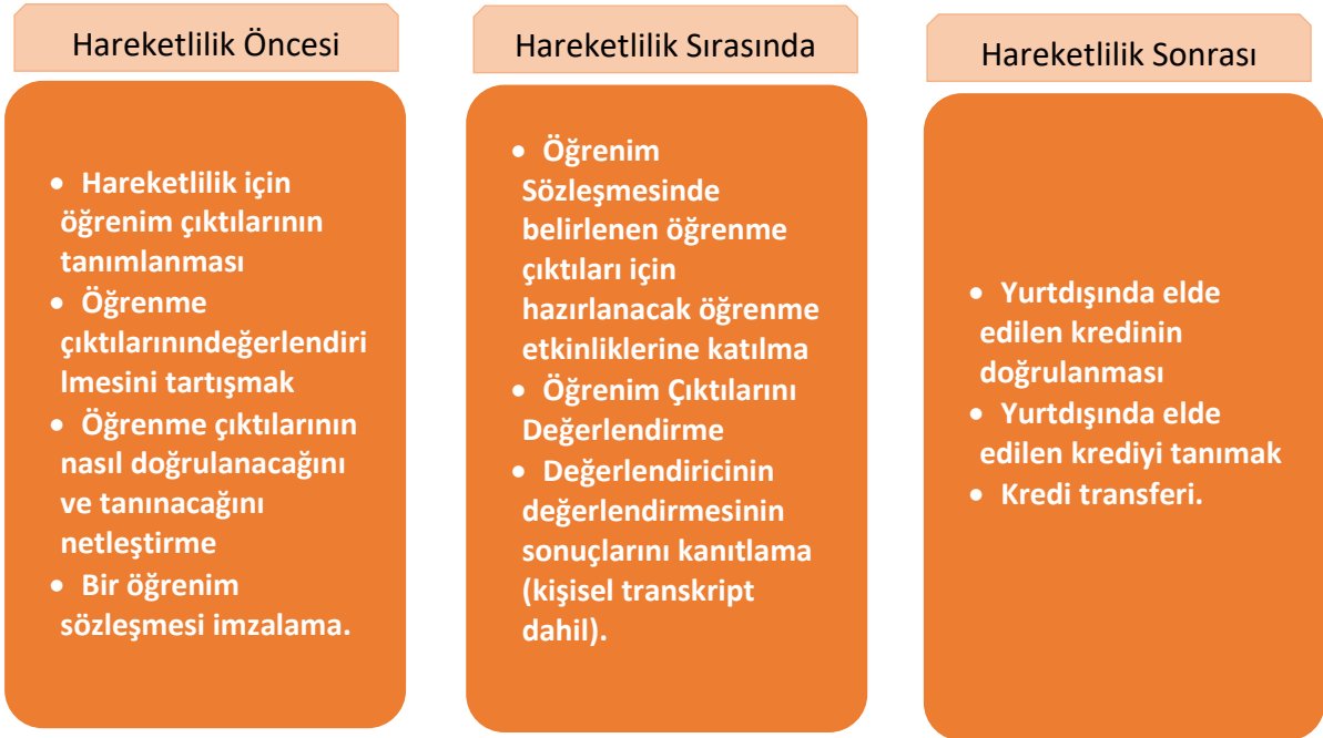
Şekil 4 ECVET kullanılırken, hareketlilik öncesinde, sırasında ve sonrasında dikkate alınacak temel konular